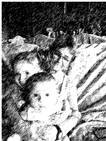
Nietas con abuela

sino la de una persona mayor con un cierto parecido a tu madre, pero que eres tú.