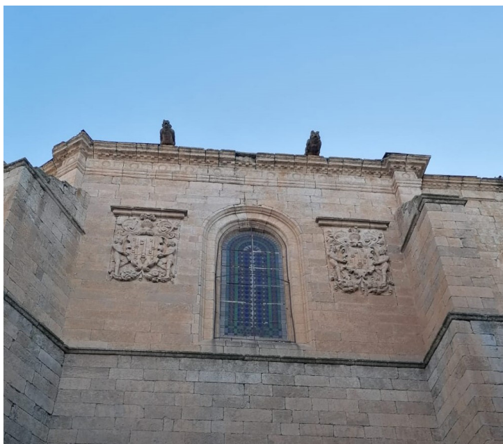
Iglesia de San Agustín en Ciudad Rodrigo en cuya pared se observan dos escudos de la familia Chaves.