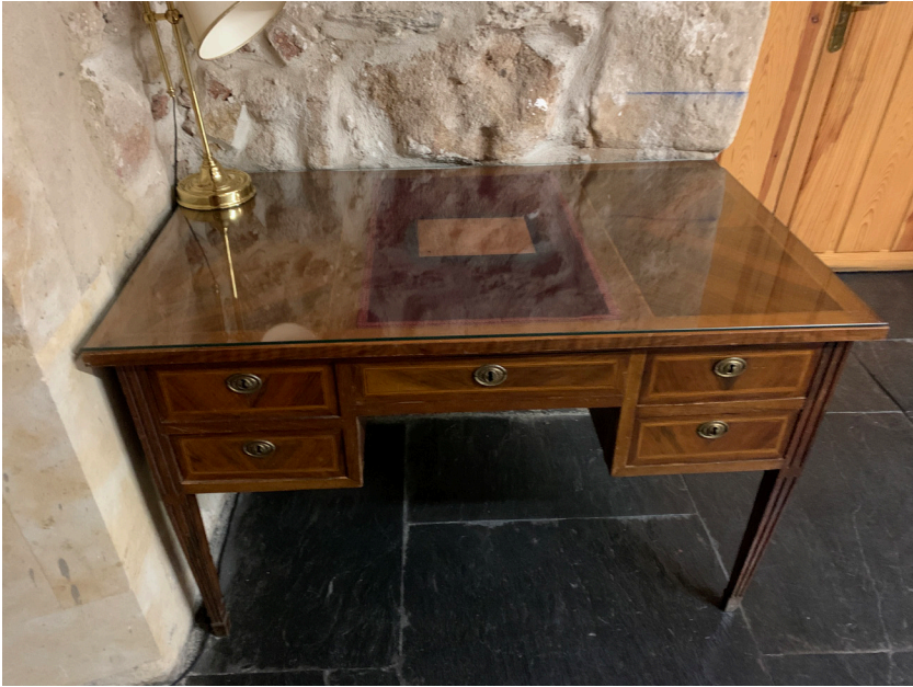
Mesa ubicada en la Sala de Grados de la Facultad de Geografía e Historia de la Universidad de Salamanca