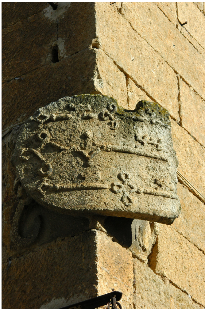
Detalle de uno de los cuatro escudos que se conservan en el Torreón de los Chaves en Ciudad Rodrigo, donde se aprecian las cinco llaves armas de la familia.