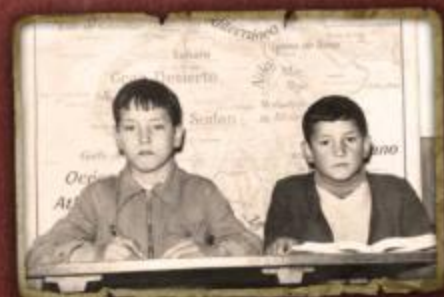
Retrato escolar Diputación: Asociación Planchales Vecinos