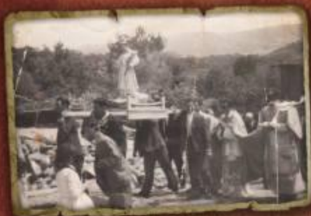
Procesión de San Ramón