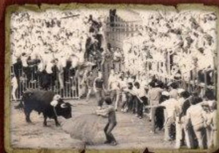
La plaza llena Depositar: Julio Rodríguez Martín