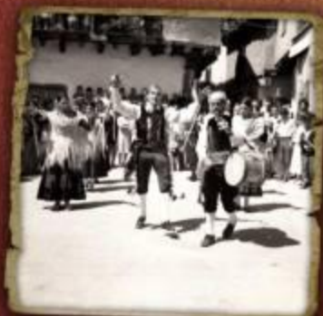
Baile en la plaza