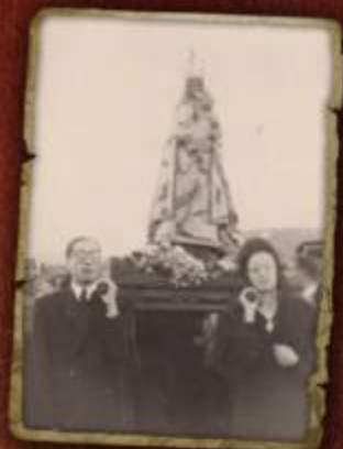
Con la Virgen de la Pila