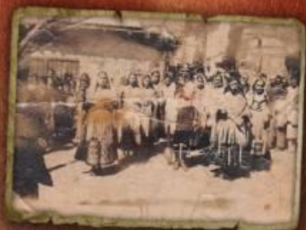
Preparación para bailar el santo