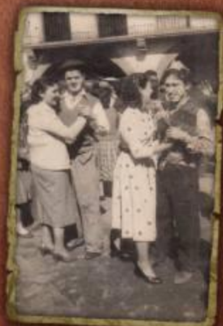
Baile en la plaza