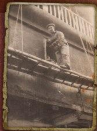
Arreglando la fachada Depositar: Víctor Martín Martín