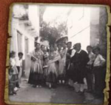
Baile en la plaza