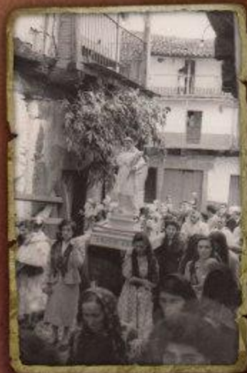
San Basilio Regando a la plaza Depositar: Susana Pérez Martín