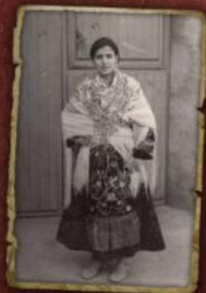
Rosario Planchales Diputación: Asociación Planchales Vecinos