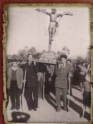
Procesión del Cristo