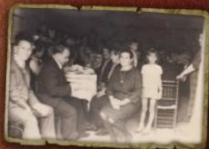
Encuentro de baile