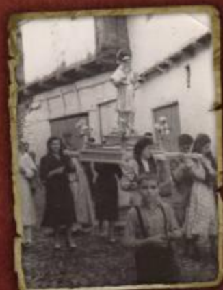
Mujeres devocidas a San Ramón