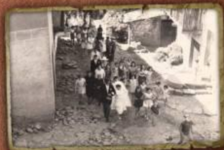
Cortejo de baile