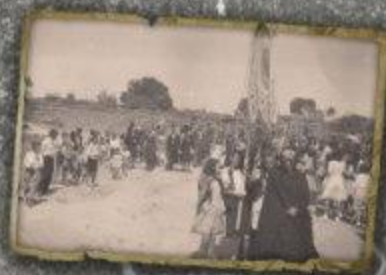
Expositor: Pepita Diego