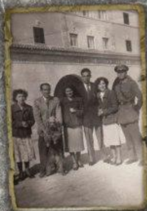
Expositor: Pablo Marchado Fz

En el estudio o en la calle. Familiares, amigos, desconocidos incluso. Posan para el fotógrafo y dan testimonio de un instante de proximidad física, afectiva, fruto de la casualidad tal vez. Somos nosotros y nuestras circunstancias. La foto da fe.