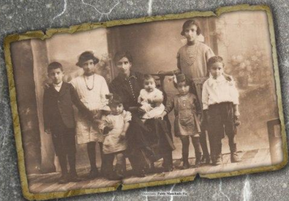
Donante: Pablo Manchado-Fr.

El estudio fotográfico es una cueva de encantamientos.