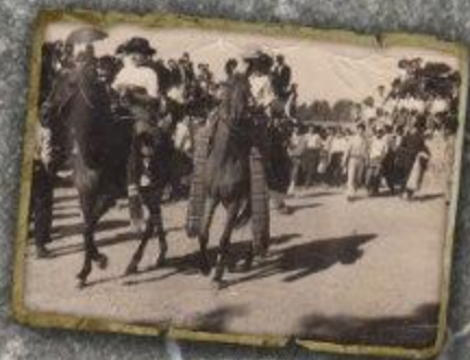
Depositar: Pepita Durán