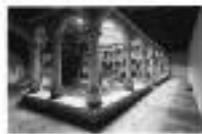
Monasterio de San Juan de los Rios